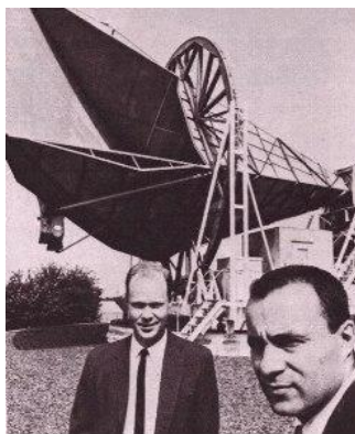
Wilson e Penzias

Wilson e Arno Penzias (Fig.5) i quali, nell'intento di risolvere le cause del rumore che disturbava le prime trasmissioni radiotelevisive via satellite, utilizzarono una tecnica innovativa per gli anni sessanta: il ricevitore Dicke. E lavorando sulla frequenza di 408 Mhz per inseguire i satelliti per telecomunicazione Echo 1 e Telestar, si accorsero che lo strumento di rilevamento misurava una massiccia radiazione provenire da tutte le direzioni dello Spazio, in tutte le ore del giorno e della notte, registrando un rumore di fondo abbastanza costante, pari ad una temperatura di circa 2.7 gradi Kelvin; ovvero: la Radiazione Cosmica di Fondo che riempie tutto l'Universo, residuo della temperatura dopo l'esplosione del Big Bang. Oggi, in Italia, il fiore all'occhiello della Radioastronomia è rappresentato dal radiotelescopio "Croce del