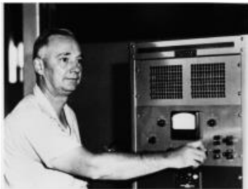
Fig. 3 Grote Reber

dalla regione centrale della nostra Galassia. Quell'emissione continua e diffusa nella banda radio era, dunque, il respiro della Via Lattea; o, quanto meno, il residuo della Radiazione di Fondo, la Radiazione Fossile generata dalla tremenda esplosione del Big-Bang avvenuta circa 14. miliardi di anni fa che diede origine all'Universo. Era nata, così, una nuova disciplina scientifica: La Radioastronomia. E, dopo la sua morte, avvenuta il 1950, la Comunità Scientifica adottò il suo cognome quale unità di misura del Flusso Radio. Infatti l'intensità del rumore generato dalla Radiazione Fossile è pari a circa tre Jansky. All'età di appena 26 anni, Jansky aveva fatto una scoperta rivoluzionaria! Attraverso la Radiazione Fossile, aveva confermato la Teoria del Big Bang e l'origine dell'Universo; teoria, confermata poi dal Telescopio Spaziale Hubble, il quale è riuscito ad osservare in banda ottica Stelle di prima generazione risalenti a