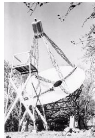
Fig. 4 STZ. W9 GFZ

di Jansky, costruì nel suo giardino un radiotelescopio amatoriale (Fig.4) costituito da una antenna di 10 metri di diametro, collegata ad un amplificatore ed a un ricevitore che operava su 3300 Mhz, 900 Mhz, e 160 Mhz, utilizzando la sua stazione astronomica soltanto di notte per ridurre il numero delle interferenze causate dai motori a scoppio delle automobili. E fu proprio di notte che sulla frequenza di 160 Mhz riuscì a registrare il rumore galattico emesso dalla nostra Galassia, confermando, così, quanto aveva già scoperto l'ing. Jansky. Da quella notte, Reber, dopo aver rielaborato tutti i dati, compilò la prima radiomappa della Galassia, tracciando le linee isoterme della distribuzione della temperatura del cielo, la Brillanza, sulla frequenza di 160 Mhz. Quanto sin qui riportato, è soltanto l'inizio, perchè a Jansky e Reber, fecero seguito altri osservatori, tra i quali Robert