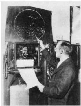
Fig.1 Karl Jansky

Ci troviamo nel XX secolo, a Holmdel, nel New Jersey, Ormai le comunicazioni radio hanno abbandonato la scienza pura e puntano verso interessi commerciali. Tra le aziende leader degli anni trenta, vi era pure la statunitense "Bell Telephone Laboratories", la quale, svolgeva un grosso business di affari con la telefonia e con le stazioni radio commerciali. Ma, qualcosa le